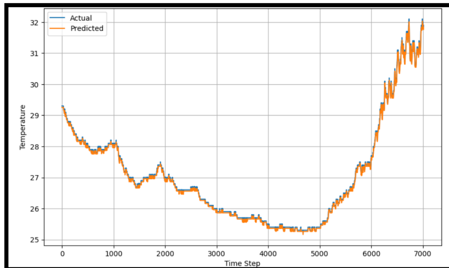
Gambar 6. Visualisasi hasil

Kode Jupyter Notebook di atas digunakan untuk memvisualisasikan hasil prediksi model terhadap data suhu aktual setelah proses pembalikan skala (rescaling). Fungsi plt.figure(figsize=(10, 6)) digunakan untuk mengatur ukuran plot agar lebih jelas dan proporsional. Dua garis plot kemudian digambarkan menggunakan plt.plot() , di mana y_test_rescaled[:, 0] merepresentasikan data suhu aktual dan predictions_rescaled[:, 0] merepresentasikan hasil prediksi dari model. Kedua garis ini diberi label "Actual" dan "Predicted" untuk membedakan keduanya dalam legenda. Meskipun judul grafik dikomentari ( # plt.title(...) ), sumbu x dan y tetap diberi label dengan plt.xlabel("Time Step") dan plt.ylabel("Temperature") , yang menunjukkan bahwa data ini direpresentasikan terhadap waktu. Fungsi plt.legend() menampilkan legenda untuk menjelaskan garis yang ditampilkan, dan plt.grid(True) menambahkan grid pada grafik agar lebih mudah membaca nilai-nilainya. Terakhir, plt.show() digunakan untuk menampilkan grafik secara keseluruhan.